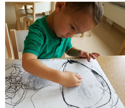
Min tanke tar form på pappret