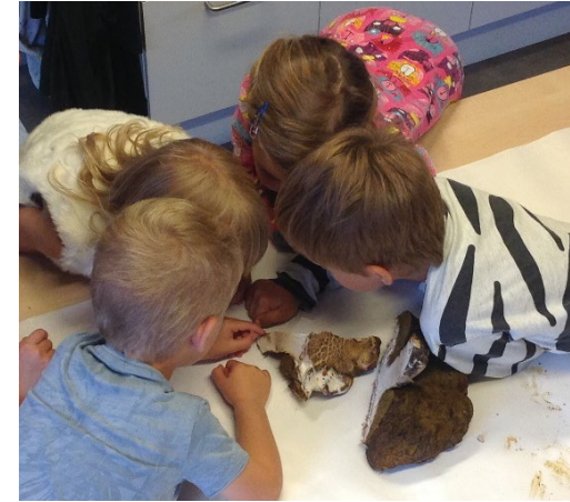
I ett undersökande tillsammans