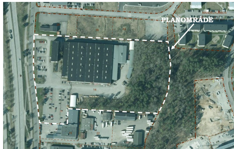
Bild på planområde

Planområdet består idag av verkstadsindustri, det är beläget i Bettorps industriområde som ligger i norra delen av Örebro, cirka 3.5 km från Örebro centrum. Planområdet omfattar fastigheten Karossen 14 som ägs av ett privat företag, EMBA AB, hela fastigheten är i gällande detaljplan reglerad till markanvändningen industri . Planområdet består främst av hårdgjorda asfalterade och bebyggda ytor. Den östra delen av planområdet är oexploaterad och utgörs av ett skogsparti.