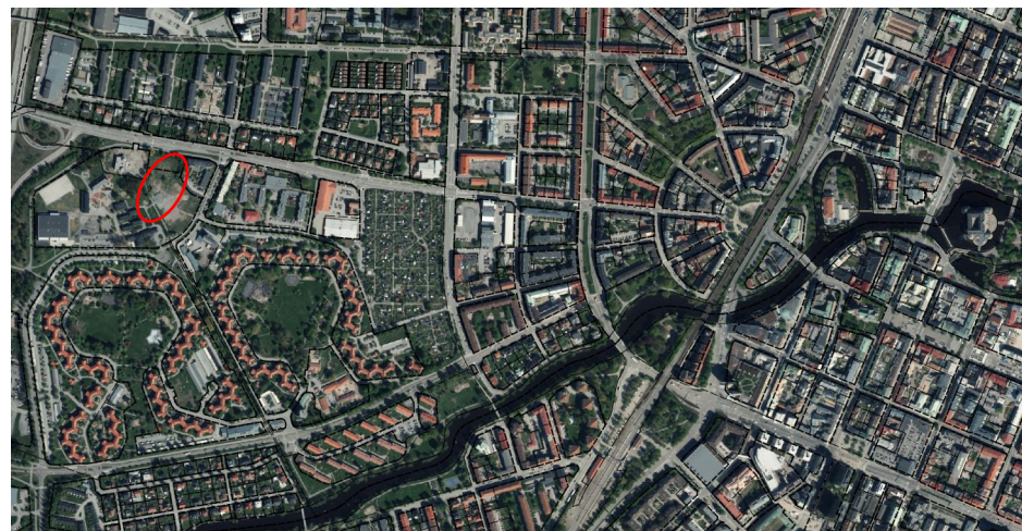
Bild på planområde

Området som berörs av planändringen ligger inom fastigheten Stjärnkikaren 3 samt Längbro 1:121 i västra Örebro. Området är i dagsläget planlagt för skoländamål och innefattar bl.a. Rostaskolan och dess utemiljöer.