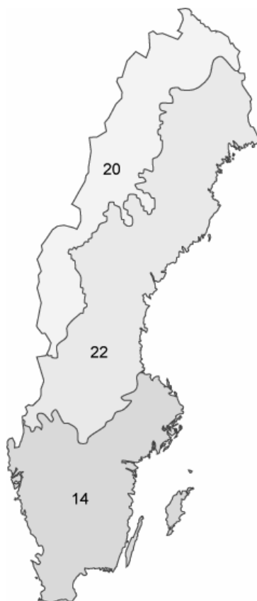
Figur 4.1. Illies ekoregioner, Central slätten (14), Fennoskandiska skölden (22) och det Boreala höglandet (20).

Konsoliderad elektronisk utgåva Uppdaterad 2019-01-01